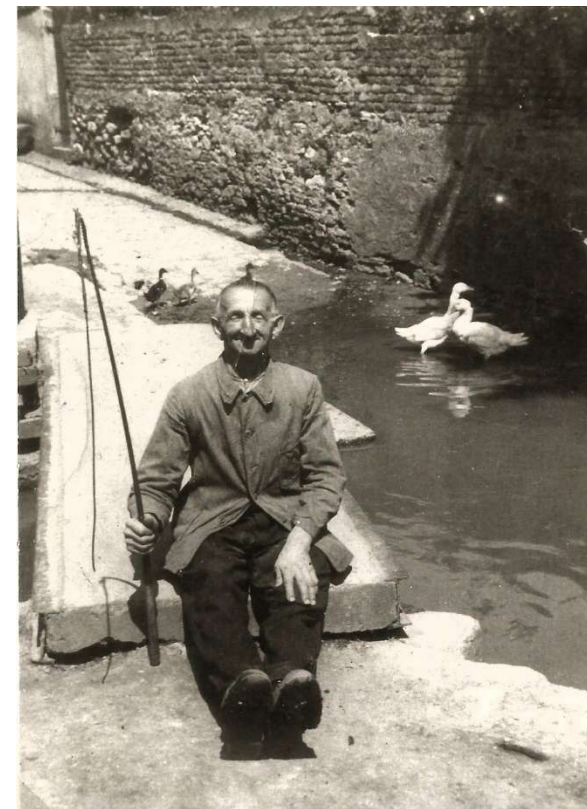
Steg an der Tränkstraße

Nun geht es über die Straße durch die Ehrenbürgerstraße in die Milchstraße zur Tränkstraße.