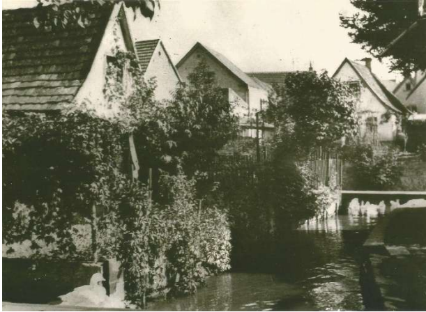
Der interessanteste Teil des Mühlbachs, von den Leiselheimern 'Klein Venedig' genannt.

Der Bereich vom Beginn der Ehrenbürgerstraße bis zur Einmündung in die Milchstraße wurde früher „Klein Venedig“ genannt.