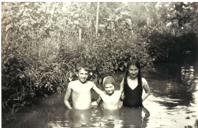
Mitte der 30er Jahre

Wir starten also in der Neuwegstraße! An dieser Stelle war der Bachlauf etwas breiter. Hier haben die Leiselheimer Kinder früher „gebadet“