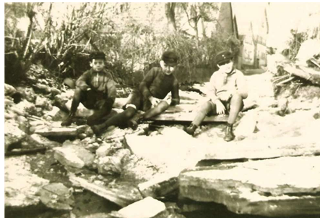
Buben beim ‚Eisschollen fahren‘

Hier war der Bachlauf etwas breiter und der Uferbereich bestand aus Morast. Es war ein Paradies für Enten und Gänse und im Winter, wenn der Bachlauf zugefroren war, eignete er sich prima als Eislauffläche.